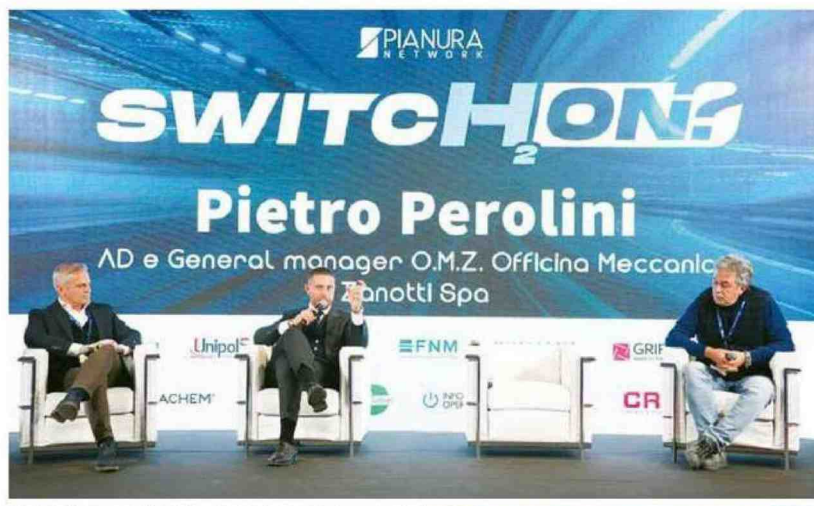
Ministero a Pianura Network in CAD. Su video in movimento di...