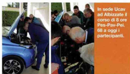
In sede Ucav ad Albizzate il corso di 8 ore Pes-Pav-Pei. 68 a oggi i partecipanti.

modalità per il recupero di un elettrico o un ibrido... Non che ne circolino molte, "ma anche se passeranno anni prima che l'officina indipendente si ritrovi il cliente con l'auto ibrida o elettrica, cosa che nelle carrozzerie accade già, i nostri riparatori si stanno dimostrando previdenti". C'è da credere che con lo stesso spirito coglieranno l'opportunità di frequentare il corso sugli ADAS che sarà calendarizzato tra aprile e maggio. "I carrozzieri soprattutto", spiega Campagna, "da tempo stanno riparando macchine dotate di dispositivi di assistenza alla guida, ormai di serie sui marchi premium. Con questo corso non vogliamo vendere attrezzature ma spiegare che cosa sono gli ADAS, come funzionano e in che modo effettuare il servizio di calibrazione e riparazione".