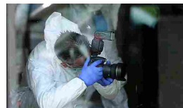
Uccisa e in pasto a maiali: Ris in casa