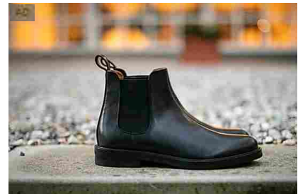
Scarpe Velasca. Fanno innamorare migliaia di persone. Velasca