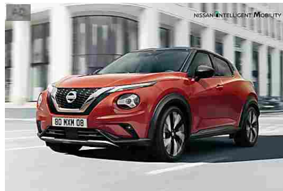
Scopri Nuovo Nissan JUKE. Il Crossover Coupé. Nissan Italia