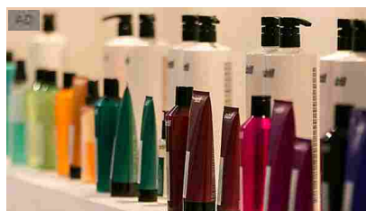
Partecipa al Buyer Program! Sarà più semplice ampliare la tua linea prodotti Cosmoprof.com