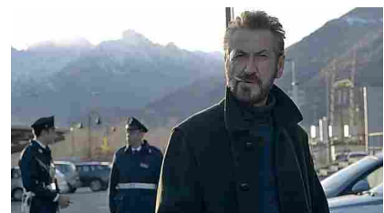
Torna Giallini-Schiavone, 'sempre più malinconico e solo' - Cultura & Spettacoli