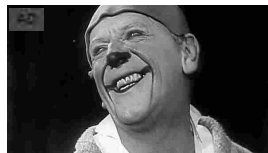
Grock: luci ed ombre di un clown leggendario Arte