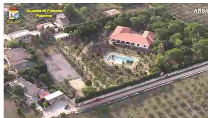
Mafia, confiscata villa da 4 mln al "re del calcestruzzo" - Italia