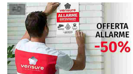
Antifurto Verisure a Febbraio in offerta -50%. Calcola preventivo verisure.it