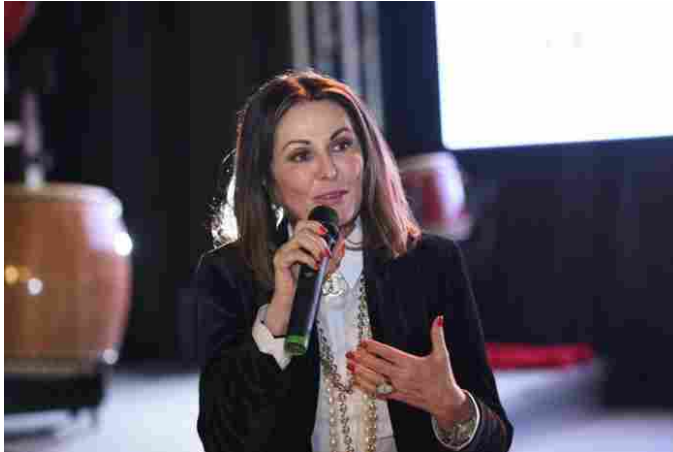
La senatrice Daniela Santanché

Industria, Commercio e Turismo del Senato