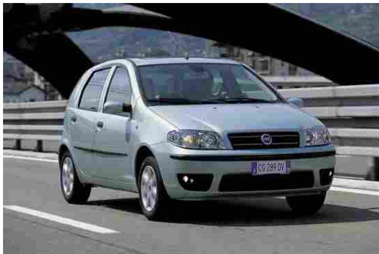
Quante auto dovranno rimanere ferme, limitate, per i blocchi? La stima è di circa 3 milioni

“Lo stop obbligato impone costi che in questo particolare momento possono essere insostenibili per molte famiglie, che si trovano di fronte a un bivio: acquistare un'auto, magari d'occasione ma sempre recente, visto che tra un anno anche le Euro4 saranno bloccate, oppure tenere il veicolo nel box, pagare assicurazione e tassa di possesso per affidarsi a un trasporto pubblico non all'altezza. Ma il problema si pone anche per i concessionari, che da un giorno con l'altro si sono trovati ad avere quasi azzerato il valore di parte del parco usato disponibile”.