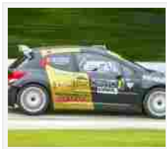
Andrenalina a Manzano