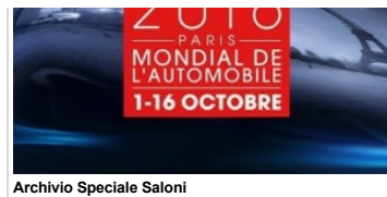
Archivio Speciale Saloni